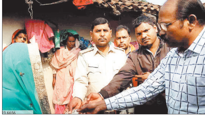
मृतक के परिजन को सहायता राशि देते अधिकारी।